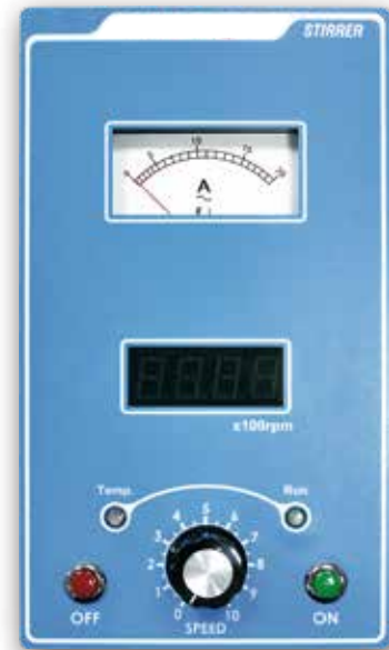
操作面板 Operation Faceplate