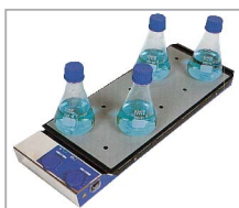
RT 10 power