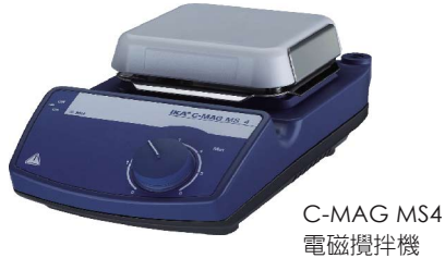
C-MAG MS4 電磁攪拌機