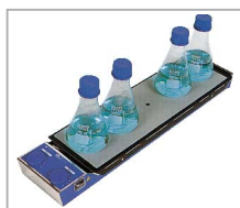
RT 5 power