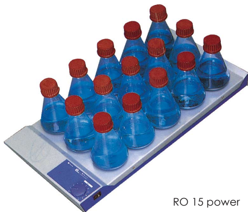
RO 15 power