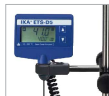
ETS-D5 溫度控制器 -50-450°C、解析度 0.1K、精確度 ±0.2K、 PID 電子溫控、Pt1000 不鏽鋼探棒