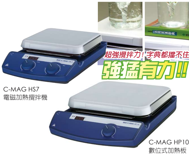
C-MAG HS7 電磁加熱攪拌機