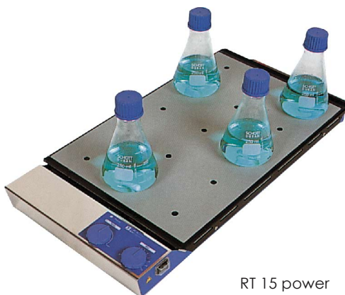
RT 15 power