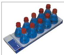
RO 10 power