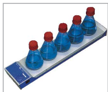
RO 5 power