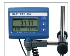
ETS-D6 精密溫度控制器 -50-450°C/0-14pH、 解析度 0.01K/0.01pH、 精確度 ±0.05K、PID 溫 控、超大液晶、Pt1000 不鏽鋼探棒、可選配 pH 電極同步顯示