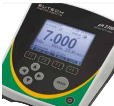
pH 2700 雙行顯示、具藍色背光照明，加大字體清晰易讀，可瀏覽GLP校正數據