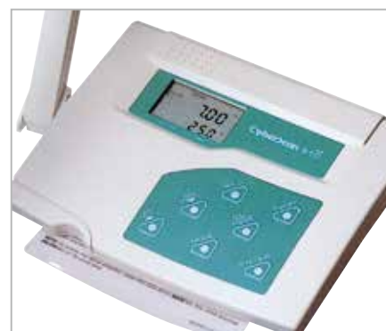
pH 510 雙行液晶顯示、面板具防潑水功能，機底附「快速操作索引卡」