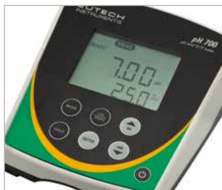
pH 700 雙行液晶顯示、面板具防潑水功能，機底附「快速操作索引卡」