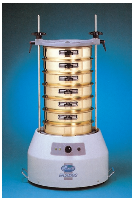
運轉燈 電源燈 計時器 保險絲

EFL 2000 是針對大量散狀樣本所設計的高負載型機種。強力振動器可確實的將振量輸送至篩網，固定頻率的垂直運動，提高樣本通過篩孔的機率，減少懸滯所浪費的時間。篩分快速、準確、再現性高，篩孔不易阻塞。全新設計的抗振式夾頭，省卻傳統的金屬彈簧，可確保篩網牢固的裝置在振盪器上，更換與拆卸方便快速，兩種機型符合多種篩網規格。本系列完全符合 EC 安全認證。