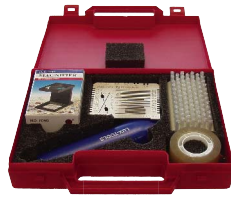
ZMG 2151.G 增加 放大鏡、刷子各一支

薄薄一片，用途多變！可應用於油漆、塗料、黏著劑... 各種測試：六種附著力（交叉切割）測試、垂流試驗、濕膜厚度，還可當作 Wedge-shaped 濕膜塗佈器。全不鏽鋼製。