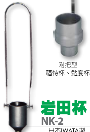
附把型 福特杯、黏度杯